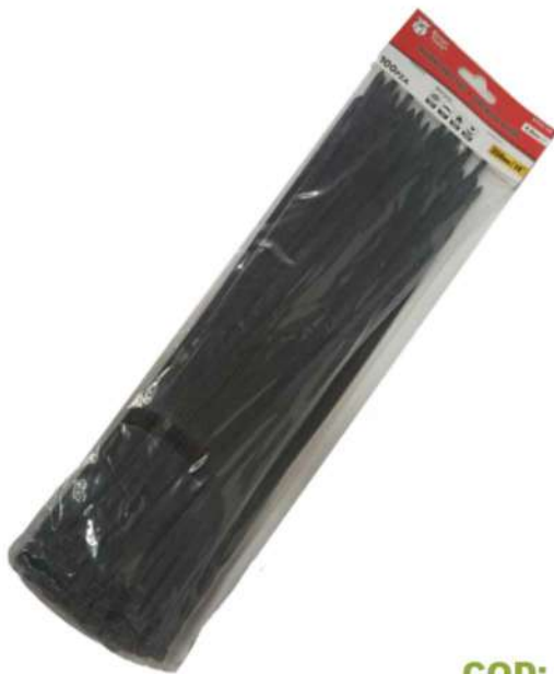
COD: NTCH-14B AMARRA PLÁSTICA NEGRA 14 PULGADAS

(1312) AMARRA NEGRA PLA STICA 14 PULGADAS BOXE