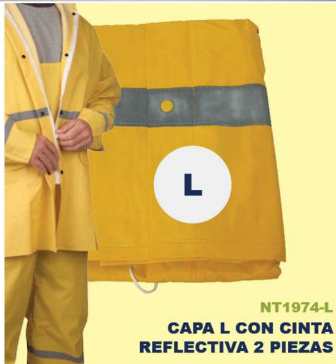
NT1974-L CAPA L CON CINTA REFLECTIVA 2 PIEZAS

(1367) CAPA 2PCS C/ CINTA REFLECTIVA XL BOXE