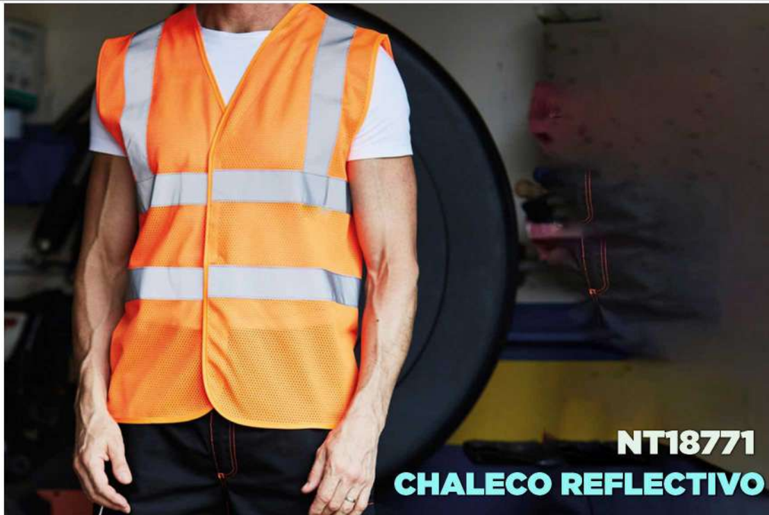
(792) CHALECO REFLECTIVO NARANJO BOXER