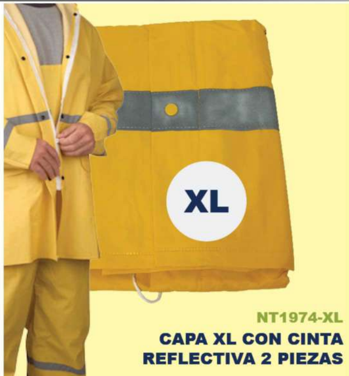
NT1974-XL CAPA XL CON CINTA REFLECTIVA 2 PIEZAS

(1367) CAPA 2PCS C/ CINTA REFLECTIVA XL BOXE