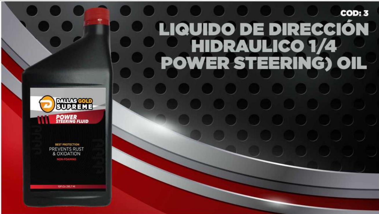
(3) LIQUIDO DIRECCION HIDRAULICO 1/4 (POWER STEERING) OIL