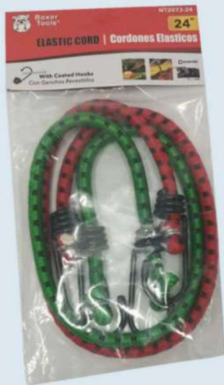
NT2073-24 LINGA AMARRA