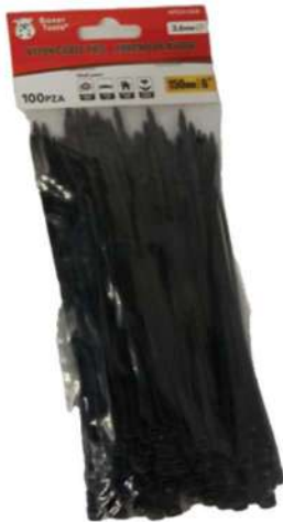
COD: NTCH-06B AMARRA PLÁSTICA NEGRA 6 PULGADAS

(1308) AMARRA NEGRA PLÁSTICA 06 PULGADAS BOXE