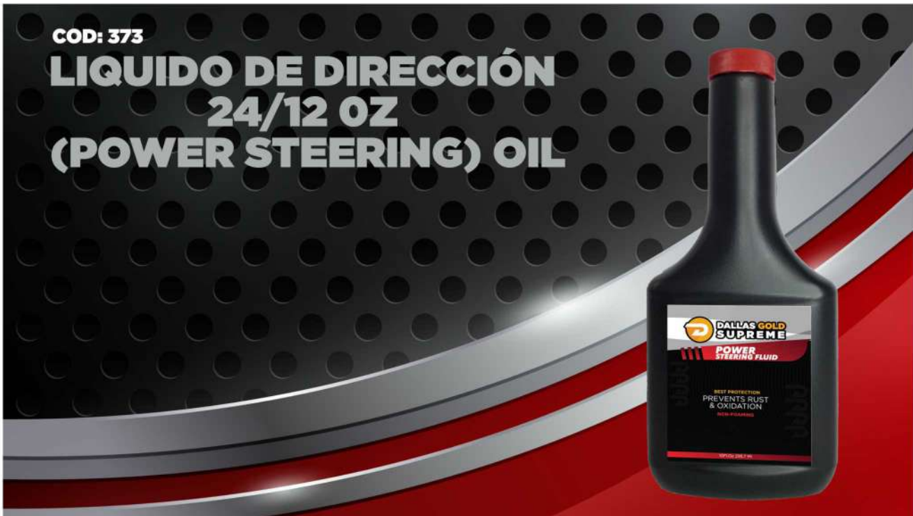
(373) LIQUIDO DIRECCION H IDRAULICO 24/12 OZ (PO