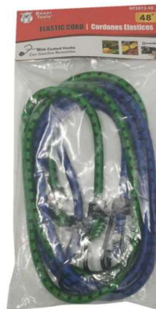
NT2073-48 LINGA AMARRA 48"