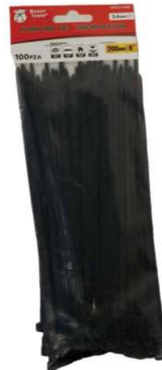
COD: NTCH-08B AMARRA PLÁSTICA NEGRA 8 PULGADAS

(1308) AMARRA NEGRA PLÁSTICA 06 PULGADAS BOXE