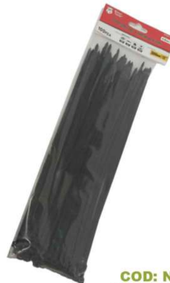
COD: NTCH-12B AMARRA PLÁSTICA NEGRA 12 PULGADAS

(1310) AMARRA NEGRA PLÁSTICA 10 PULGADAS BOXE