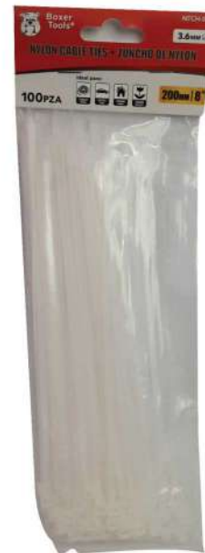
COD: NTCH-8" AMARRA PLÁSTICA BLANCA 8 PULGADAS

(1314) AMARRA NEGRA PLA STICA 18 PULGADAS BOXE