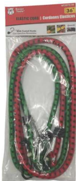
NT2073-36 LINGA AMARRA 36"