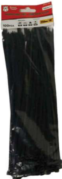
COD: NTCH-10B AMARRA PLÁSTICA NEGRA 10 PULGADAS

(1309) AMARRA NEGRA PLÁSTICA 08 PULGADAS BOXE