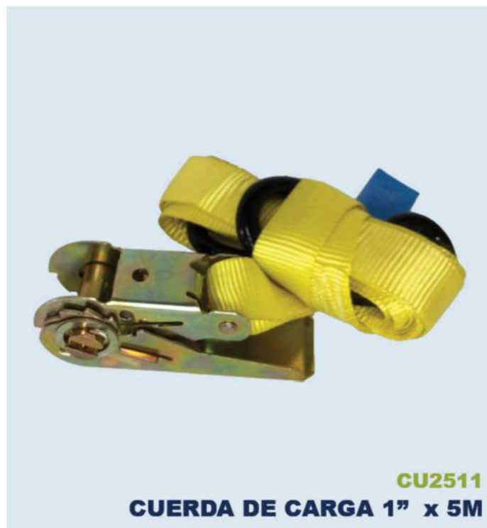
CU2511 CUERDA DE CARGA 1" x 5M

(608) TRIANGULO REFLECTIVO JM2 650G TRUPE