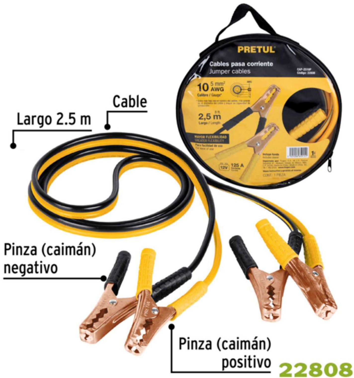
(148) CABLE JUMPER BATERIA 400A TRADIC. PH PRETUL