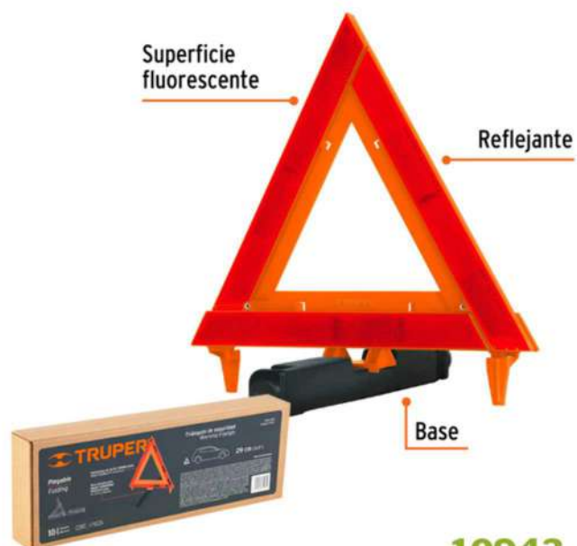
10943 TRIÁNGULO DE SEGURIDAD PLEGABLE

(1366) CAPA 2PCS C/ CINTA REFLECTIVA L BOXE