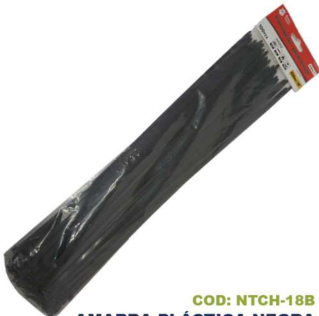
COD: NTCH-18B AMARRA PLÁSTICA NEGRA 18 PULGADAS

(1313) AMARRA NEGRA PLA STICA 16 PULGADAS BOXE