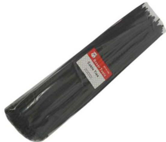
COD: NTCH-16B AMARRA PLÁSTICA NEGRA 16 PULGADAS

(1312) AMARRA NEGRA PLA STICA 14 PULGADAS BOXE