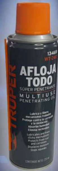
(1665) ACEITE LUBRICANTE WT-235ML 240 TRUPER

1665 ACEITE LUBRICANTE WT-235ML WT-240 TRUPER